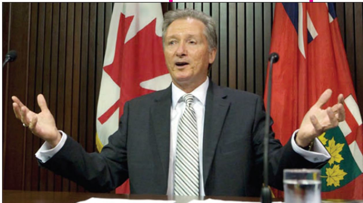
Ontario Auditor General Jim McCarter's report on eHealth criticizes the agency for relying too much on consultants and for lacking strategic direction.

Instead, Ontario "is near the back of the pack" when it comes to electronic health