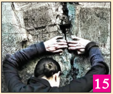
Conversation with History & Future Orientation