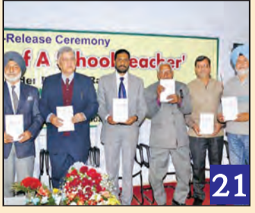
ਇਕ ਸਕੂਲ ਅਧਿਆਪਕ ਦੇ ਜੀਵਨ ਸਫਰ ਦੀ ਕਹਾਣੀ ਅਤੇ ਸਕੂਲੀ ਸਿੱਖਿਆ