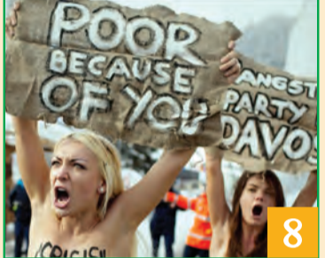
power of capitalism & Its impact on economic inequality