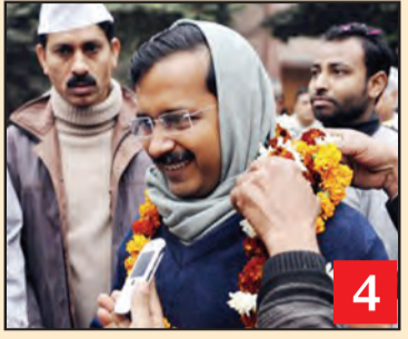
ਰਾਜਨੀਤਕ ਖੇਤਰ 'ਚ ਖੜ੍ਹੇ ਕੀਤੇ ਜਾ ਰਹੇ ਨਵੇਂ ਸਵਾਲ