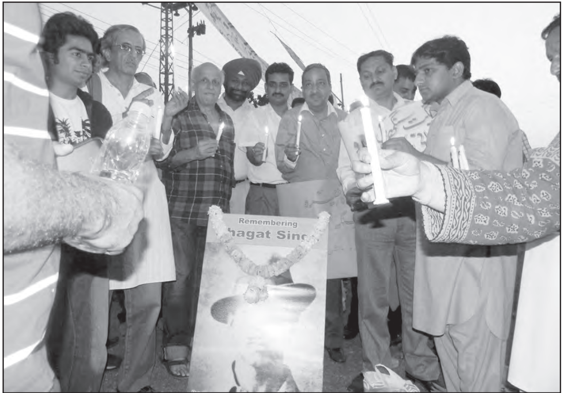
23 ਮਾਰਚ 2012 ਨੂੰ ਲਾਹੌਰ ਦੇ ਸਦਮਨ ਚੌਕ ਵਿਖੇ ਸ਼ਹੀਦ-ਏ-ਆਜ਼ਮ ਭਗਤ ਸਿੰਘ ਦੀ ਫਾਂਸੀ ਵਾਲੇ ਸਥਾਨ 'ਤੇ ਸ਼ਰਧਾਂਜਲੀ ਭੇਟ ਕਰਦੇ ਹੋਏ।