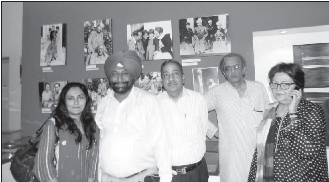
ਫੈਜ਼ ਅਹਿਮਦ ਫੈਜ਼ ਦੀ ਬੇਟੀ ਸਲੀਮਾ ਹਾਸ਼ਮੀ ਨਾਲ ਫੈਜ਼ ਦੀ ਯਾਦਗਾਰ ਸਥਾਨ 'ਤੇ ਡੈਲੀਗੇਟਜ਼

ਬੇਸ਼ਕ ਵਿਸ਼ਵੀਕਰਨ ਦੇ ਦੌਰ ਨੇ ਸਮੁੱਚੀ ਦੁਨੀਆ ਵਿੱਚੋਂ ਛੋਟਾ ਵਪਾਰੀ ਅਤੇ ਹੱਥ ਕਾਮੇ ਖਤਮ ਕਰਨ ਦਾ ਅਹਿਦ ਲਿਆ ਹੋਇਆ ਹੈ। ਮੁੱਥਈ ਅਤੇ ਕਰਾਚੀ ਵਿੱਚ ਸਥਿਤ ਵਪਾਰ ਦੀਆਂ ਵੱਡੀਆਂ ਮੱਛੀਆਂ ਹੱਥੋਂ ਹੋ ਰਹੇ ਸ਼ੋਸ਼ਣ ਕਾਰਨ ਸਮੁੱਚੇ ਦੌਰੇ ਦੌਰਾਨ ਜੋ ਉਤਸ਼ਾਹ, ਪਿਆਰ ਅਤੇ ਉਲਾਰ ਛੋਟੇ ਅਤੇ ਮੱਧਵਰਤੀ ਵਪਾਰੀਆਂ ਨੇ ਦਿਖਾਇਆ ਉਹ ਨਵੀਂ ਕਿਰਨ ਵਾਲੀ ਸਵੇਰ ਦੀ ਆਮਦ ਦੀ ਇੱਕ ਦਸਤਕ ਹੈ। ਇਹਨਾਂ ਹੀ ਸਨੇਹੀਆਂ ਦਾ ਵਫ਼ਦ 11 ਅਪਰੈਲ ਨੂੰ ਭਾਰਤ ਪਹੁੰਚ ਕੇ ਆਪਣੇ ਵਪਾਰ ਦੀਆਂ ਸੰਭਾਨਾਵਾਂ ਖੋਜਣ ਅੰਮ੍ਰਿਤਸਰ, ਜਲੰਧਰ, ਲੁਧਿਆਣਾ, ਦਿੱਲੀ ਅਤੇ ਕਾਨਪੁਰ ਘੁੰਮ ਰਿਹਾ ਹੈ। ਵਾਹਗੇ ਦੇ ਬਾਰਡਰ ਤੇ 130 ਕਰੋੜ ਦੀ ਲਾਗਤ ਨਾਲ ਉਸਾਰੀ ਅਤੇ ਭਾਰਤ-ਪਾਕਿ ਦੇ ਵਪਾਰਕ ਰਿਸ਼ਤਿਆਂ ਨੂੰ ਸਮਰਪਿਤ ਸੰਗਠਤ ਜਾਂਚ ਚੌਕੀ ਇੱਕ ਨਵਾਂ ਅਧਿਆਇ ਸਿਰਜ ਚੁੱਕੀ ਹੈ। ਹੁਣ ਉਹ ਦਿਨ ਦੂਰ ਨਹੀਂ ਜਦੋਂ ਇਹ ਵਪਾਰੀ ਵਰਗ ਮਿੱਠੇ ਰਿਸ਼ਤਿਆਂ ਦੀ ਇੱਕ ਤਵਾਰੀਖ ਸਿਰਜੇਗਾ ਅਤੇ 1996 ਤੋਂ ਤੁਰੇ ਇਸ ਕਾਫਲੇ ਦੀ ਇਹ ਸੱਧਰ ਵੀ ਪੂਰੀ ਹੋਵੇਗੀ ਕਿ ਇੱਧਰਲੇ ਪੰਜਾਬੀ ਲਾਹੌਰ ਦੀ ਫੂਡ ਸਟਰੀਟ ਵਿੱਚ ਰਾਤ ਦਾ ਖਾਣਾ ਖਾ ਕੇ ਵਾਪਸ ਅੰਮ੍ਰਿਤਸਰ ਆਪਣਾ ਨਾਸ਼ਤਾ ਕਰਿਆ ਕਰਨਗੇ।