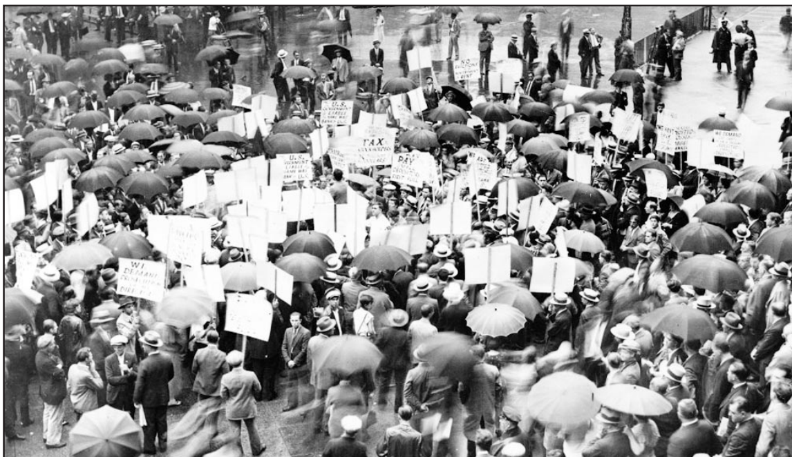
Demonstrations in 1930

This is the fate, along with perpetually high rates of unemployment and stagnant wages that awaits populations in the West, unless there is