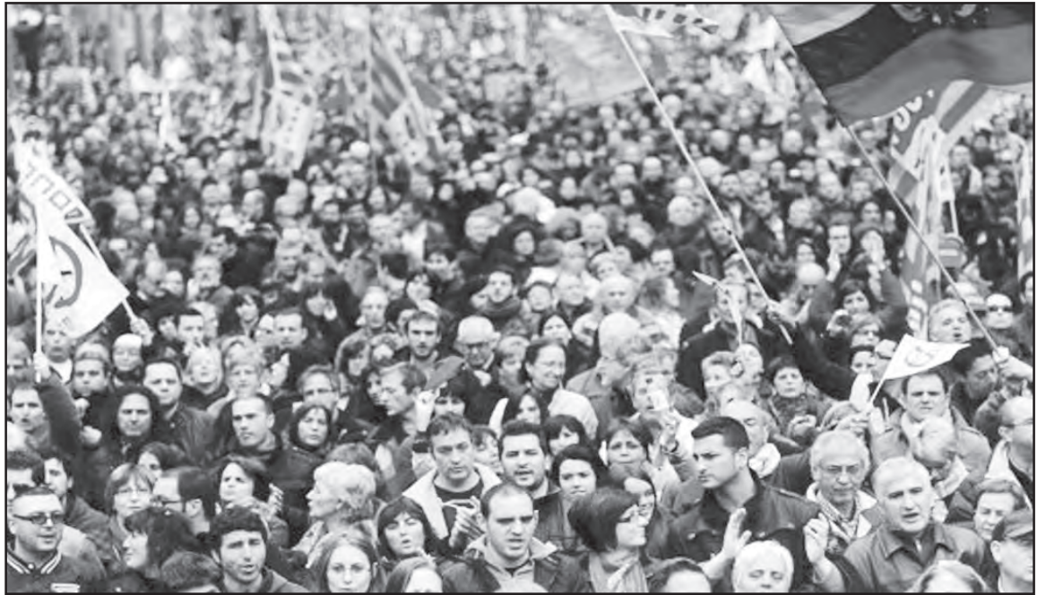
Debt Crisis and Demonstrations in latin America

We are, I believe, at an inflection point in the history of capitalism. The compound rates of growth that have prevailed over the past two centuries are increasingly difficult to sustain. Is continuous compound growth (at a minimum rate of 3 per cent a year) in perpetuity possible in